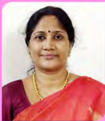
P.N. Savitry Coordinator