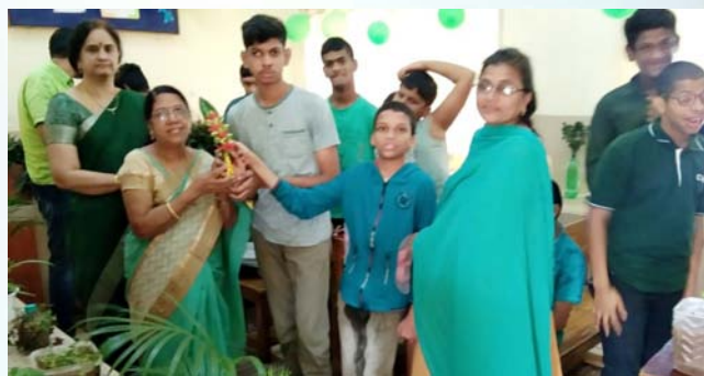
AD programme at VUDA children theatre-With District Collector and Sports events