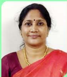
P.N. Savitry Coordinator