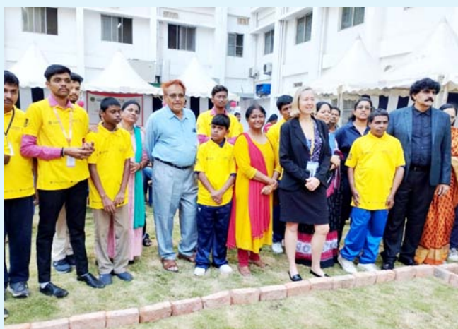
Bocce competition held at Gitam University -with dignitaries

Another event worth mentioning is that- ‘Special Olympic Bharath’ conducted Unified BOCCE games for special schools and GITAM university as a part of inclusive development.