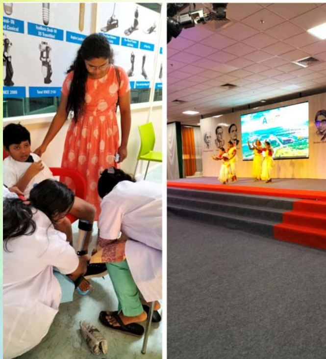
Art and Craft Day

International week of the disabled Donation of supportive devices to 15 students by AMTZ and Students' performance