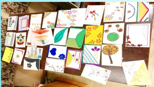
Students' New Year greeting cards project